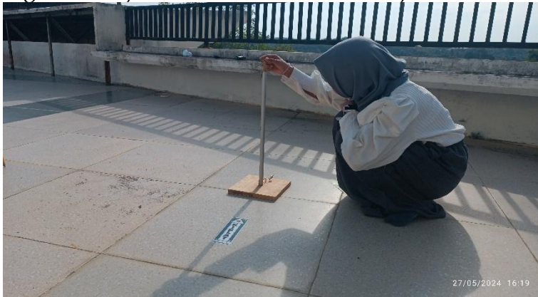
Gambar 1. Uji coba Rasdul kiblat tahunan

Ka'bah, maka matahari berada tepat di zenit Ka'bah yakni di atas kepala jika seseorang berdiri di lokasi Ka'bah. Akibatnya, cahaya matahari jatuh tegak lurus di atas Ka'bah, dan bayangan benda tegak lurus di tempat lain di bumi akan mengarah langsung ke Ka'bah. Fenomena ini terjadi dua kali setiap tahun, yaitu sekitar tanggal 27 atau 28 Mei dan 15 atau 16 Juli, dan dapat dimanfaatkan oleh umat Islam untuk menentukan arah kiblat secara akurat tanpa perlu alat bantu modern, peristiwa bayangan ini terjadi di Indonesia kekitaran jam 4 sore. 11