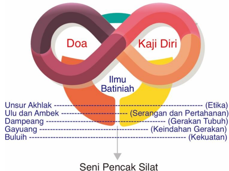
Gambar 1: Konstruk Model Nilai Sufistik di dalam Pencak Silat

Gambar 1 menerangkan integrasi nilai yang terkandung di dalam pencak silat. Termasuk seni Ulu Ambek, merupakan bentuk seni bela diri yang memiliki nilai lintas budaya yang diakui secara global. Nilai-nilai ini sering kali berasal dari praktik kehidupan lokal yang unik, dalam hal ini, sistem nilai masyarakat Minangkabau. Praktek dan pelestarian seni Pencak Silat, termasuk Ulu Ambek, mengikuti kode etik khusus yang dikenal sebagai pepatah adat. Pepatah adat ini berasal dari nilai-nilai alamiah dan Islam, yang memandu urusan antarbudaya dalam masyarakat Minangkabau.