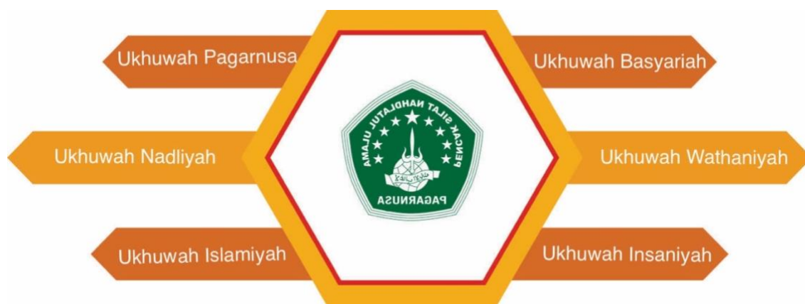
Gambar 1: Nilai Persaudaraan Pagar Nusa

Gambar 1 mengungkap esensi dari implementasi nilai religius pagar nusa adalah nilai persaudaraan yang terbagi menjadi enam komponen fundamental, yaitu nilai ukhuwah pagar nusa, nilai ukhuwah basyariyah, nilai ukhuwah nadliyah, nilai ukhuwah islamiyah, nilai ukhuwah wathaniyah, nilai ukhuwah insaniyah. Keenam nilai tersebut menjadi panduan sebagai norma dalam pembentukan pendidikan karakter. Pencak silat sebagai salah satu kegiatan ekstrakurikuler di sekolah sangat berperan dalam pembentukan karakter.