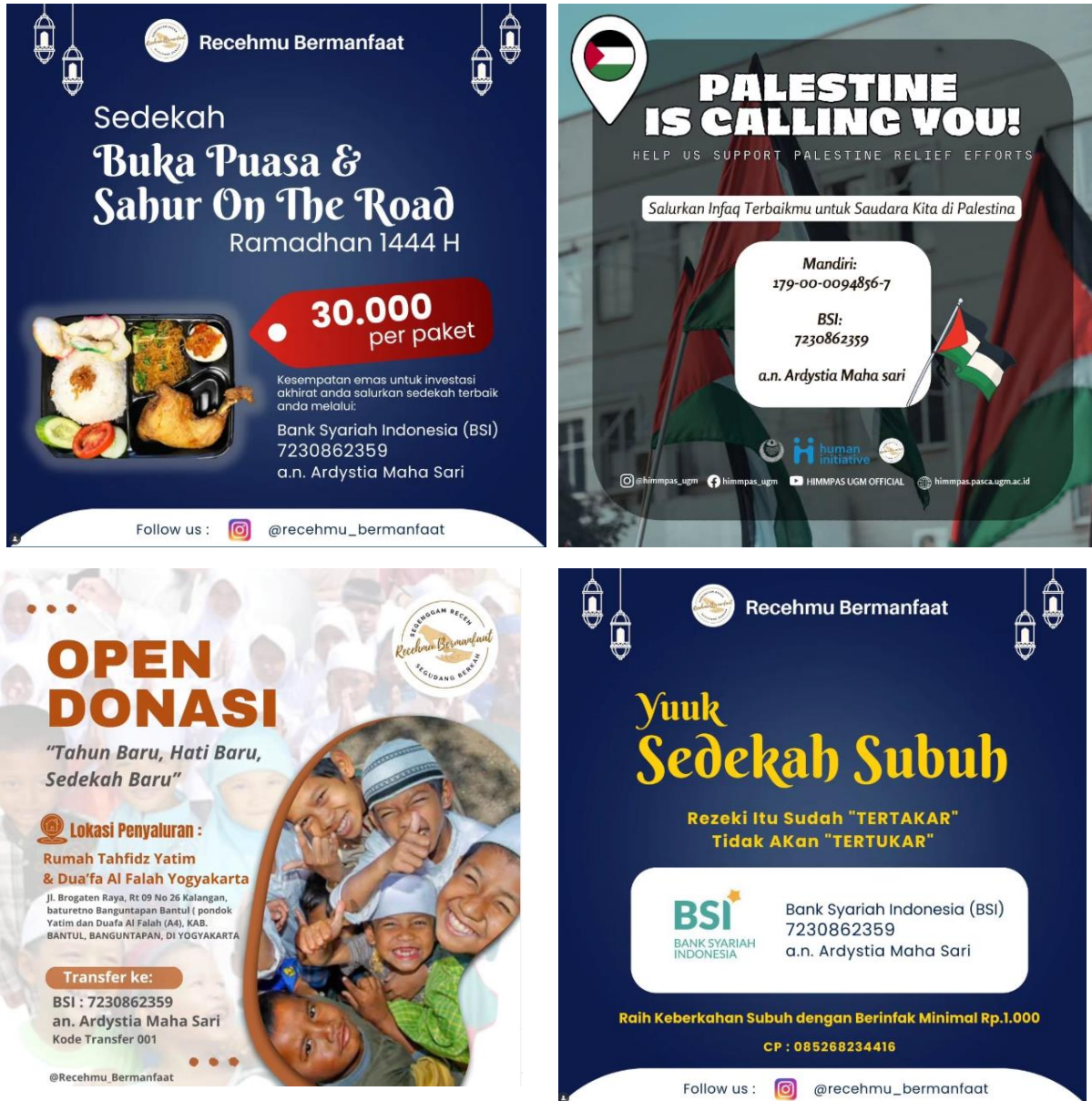
Gambar 2. Beberapa contoh Poster Informasi Mengenai Cara Berdonasi Program recehmu_bermanfaat

Gambar 2 memperlihatkan variasi poster digital yang digunakan untuk menginformasikan tata cara berdonasi dalam program recehmu_bermanfaat , termasuk ajakan berdonasi, nomor rekening tujuan, dan penjelasan singkat mengenai tujuan penggalangan dana serta sasaran penerima manfaat. Poster dirancang dengan visual yang menarik untuk meningkatkan perhatian dan partisipasi masyarakat. Pada minggu pertama pelaksanaan, respons warga sangat positif. Beberapa warga bahkan memberikan donasi melebihi nominal receh, dengan mentransfer uang dalam jumlah kecil hingga uang kertas melalui rekening resmi program. Hal ini menunjukkan tingkat kepercayaan yang tinggi terhadap sistem digital yang dibangun dan dikelola secara terbuka.