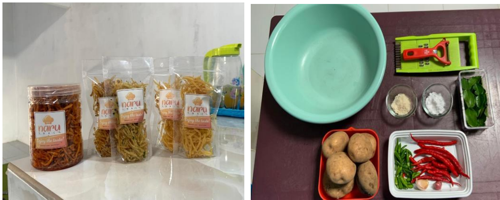
Gambar 2. Produk dan Bahan UMKM

Gambar 1 mendeskripsikan tentang pelaku usaha diminta untuk memasukkan data data seperti informasi outlet dalam proses pengurusan sertifikasi halal yang dilakukan pada sistem SiHalal. Selanjutnya proses pengisian informasi untuk pengajuan sertifikasi berupa data pelaku usaha. Kemudian surat pernyataan pelaku usaha juga dibutuhkan untuk menyatakan bahwa bahan-bahan yang digunakan dalam proses pembuatan produk adalah bahan-bahan yang halal. Proses pengurusan sertifikat halal ini dapat diterbitkan dalam waktu yang cukup lama hingga lebih dari satu bulan.