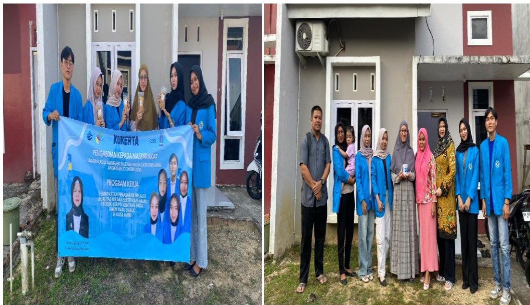
Gambar 3. Pembuatan Sertifikasi Halal

Gambar 1 mendeskripsikan tentang pelaku usaha diminta untuk memasukkan data data seperti informasi outlet dalam proses pengurusan sertifikasi halal yang dilakukan pada sistem SiHalal. Selanjutnya proses pengisian informasi untuk pengajuan sertifikasi berupa data pelaku usaha. Kemudian surat pernyataan pelaku usaha juga dibutuhkan untuk menyatakan bahwa bahan-bahan yang digunakan dalam proses pembuatan produk adalah bahan-bahan yang halal. Proses pengurusan sertifikat halal ini dapat diterbitkan dalam waktu yang cukup lama hingga lebih dari satu bulan.